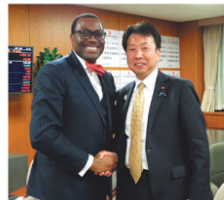
アフリカ開発銀行のアデシナ総裁と会談