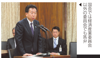
国会では経済産業委員会以外の委員会でも答弁

また、現場の視察や声を聴くことも大切であるとの思いから、原発の視察をはじめ、中小企業の視察、皆様との意見交換会などさまざまな活動に取り組んでいます。