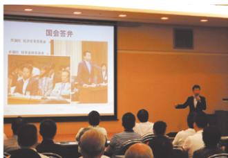
国政報告会の開催（伊丹）