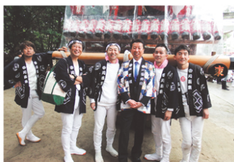
川面神社秋祭り（宝塚）