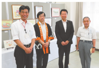
神津のシルバーフェスティバル（伊丹）