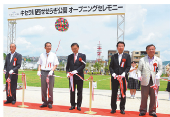
キセラ川西せせらぎ公園オープニング（川西）