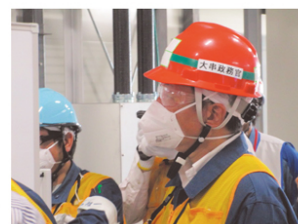
福島第一原発の廃炉処理の現場を視察