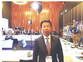
スウェーデンで開催されたミッションイノベーション大臣会合に出席