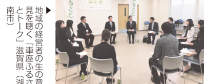
地域の経営者の生の意見を聴く「車座ふるさとトーク」滋賀県（湖南市）