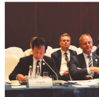
中国で開催されたクリーンエネルギー大臣会合にて発言