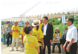
桜台リバーサイドフェスタ（伊丹）

また、各地で集会を開催し、国政での活動についてご報告をさせていただくとともに、皆様と直接お話しできる機会を積極的に設けています。今後もこの姿勢を変えることなく、引き続き地域をくまなく回ってまいります。どこかで見かけましたら、ぜひお声をかけてください。