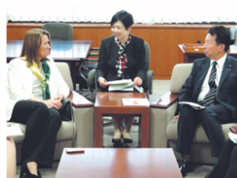
国連プロジェクト・サービス機関（UNOPS）のファレモ事務局長と会談