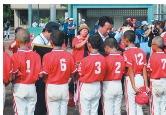
軟式少年野球の表彰式（宝塚）