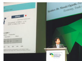
南アフリカで開催されたアフリカ鉱業投資会議で基調講演

経済産業大臣政務官の仕事は多岐にわたります。大臣の代理として国を代表して国際会議（大臣会合）などで発言をする機会が多くあります。また、世界各国の要人が日本を訪問される際には、窓口としての対応が求められます。